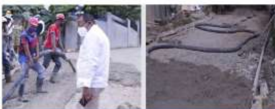
Encementado Callejón de Chita, en los Ginebra