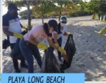
PLAYA LONG BEACH