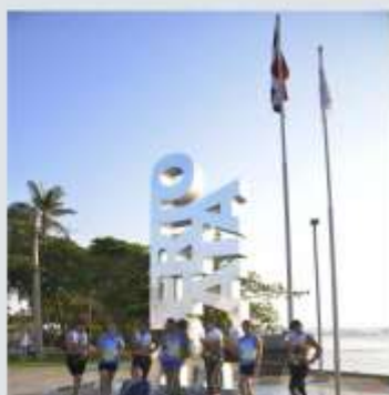
ENTREGA DE MEDALLAS PARA EVENTOS DEPORTIVOS