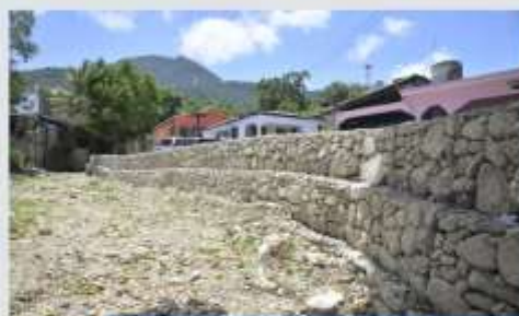
Muros de Gaviones Altos de Chavón