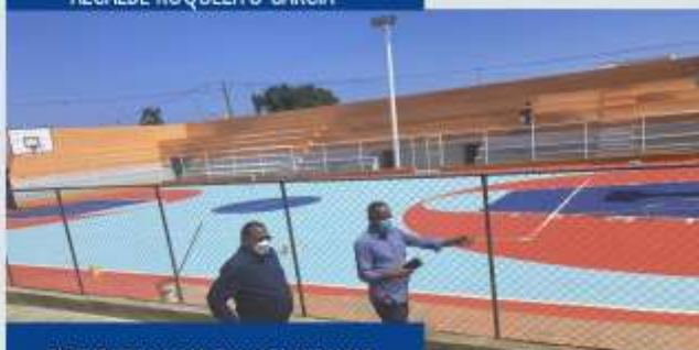
PINTURA DE LA CANCHA LIGA MIRAMAR