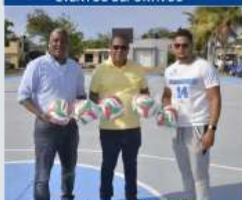
ENTREGA DE UTILERIAS DEPORTIVAS