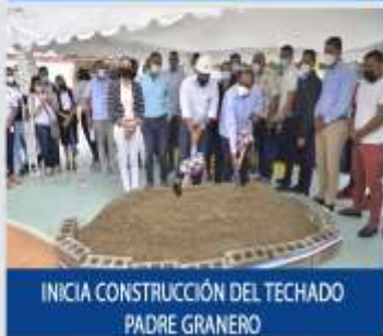
INICIA CONSTRUCCIÓN DEL TECHADO PADRE GRANERO