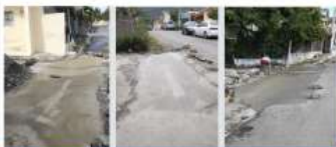
Reparación de Badenes Los Maestros, Los Ginebra y Anteramota