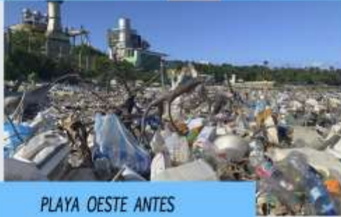
PLAYA OESTE ANTES