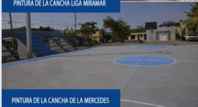
PINTURA DE LA CANCHA DE LA MERCEDES