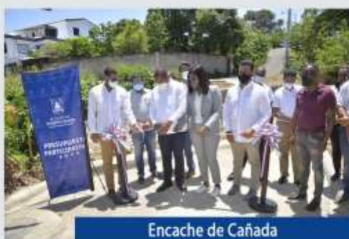
Encache de Cañada Kilometro 3