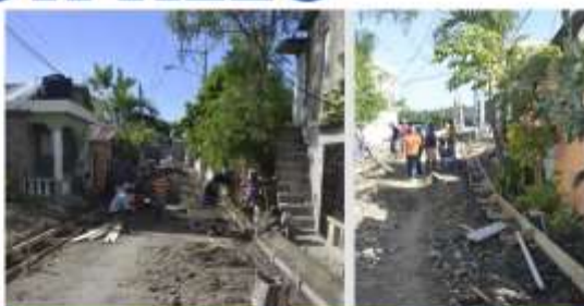
Aceras y contenes en el sector de Los Palomos