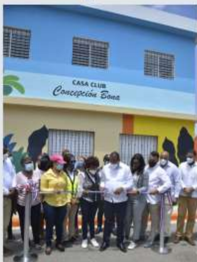
Casa Club Concepción Bona CONANI