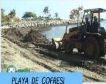
PLAYA DE COFRESI