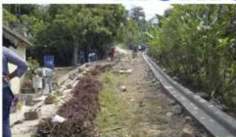
Aceras y contenes en el sector Dilesa