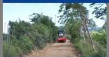
LOMA DEL GALLO