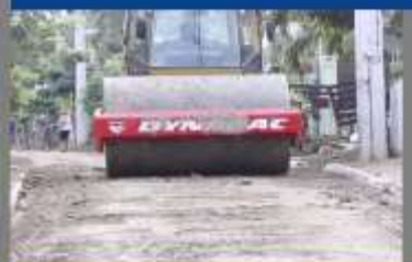
LA CUEVA SAN MARCOS