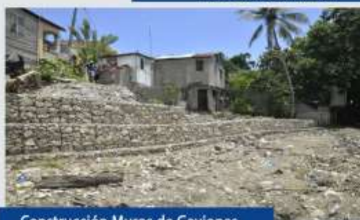
Construcción Muros de Gaviones Los Dominguez