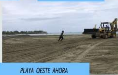
PLAYA OESTE AHORA

Con la limpieza permanente de cañadas las inundaciones ya no son un problema