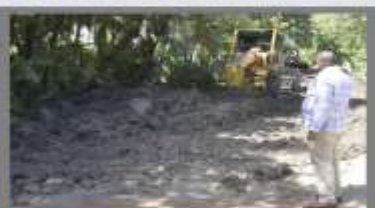
COSTAMBAR - COFRESI