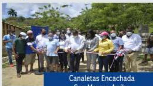
Canaletas Encachada San Marcos Arriba