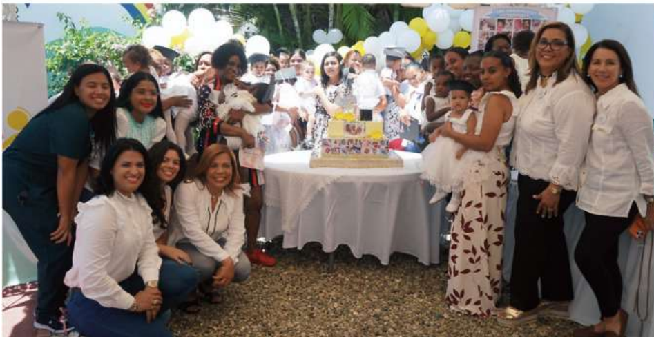
El Voluntariado Jesús con los Niños y el Hospital Ricardo Limardo graduaron los primeros 25 niños del programa Mamá Canguro, dirigido a recién nacidos prematuros y que reciben orientaciones junto a sus familias para superar esta condición

San Marcos será elevado a distrito municipal