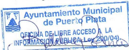
Bellaline Polanco Compareciente